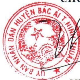
Phan Ninh Thuận